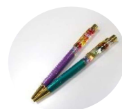
作成した ハーバリウムペン